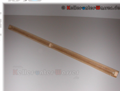
Abbildung 3: Die „Spitze des ‚M’s“

Anschließend wurde dann der Mittelteil an der Abdeckung der Trockenraumleuchte befestigt (siehe Abbildung 4), die „Spitze des ‚M’s“ aufgeleimt und – nach Aushärten des Leims – der Mittelteil mit Spiegelfolie