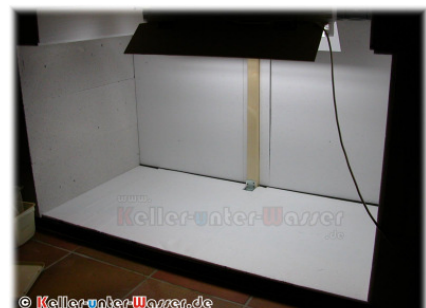
Abbildung 6: Erster Test am Bestimmungsort

beklebt. Diese lässt sich ganz einfach aufkleben und dann mittels eines weichen Tuchs glätten.