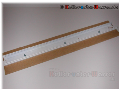
Abbildung 4: Befestigung an Trockenraumleuchte