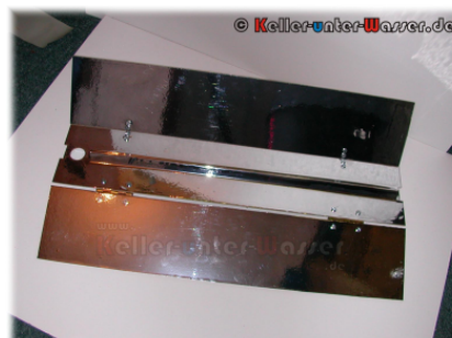
Abbildung 5: Fertig ist der Reflektorkörper