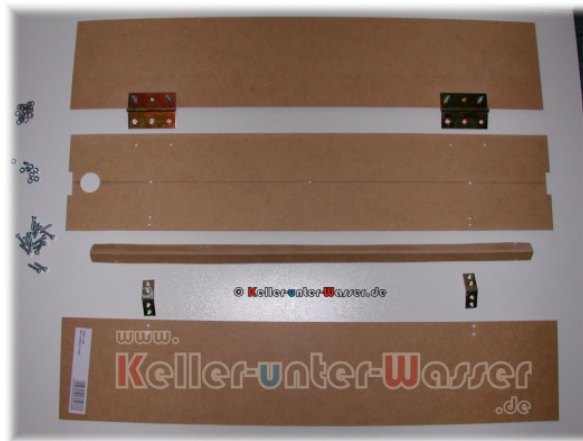
Abbildung 1: Benötigte Materialien (HDF-Platte bereits zurechtgeschnitten)

Als Beleuchtung sollte eine Standard-Trockenraumleuchte mit 1x18 Watt T8 dienen. Diese bekommt man schon für 5-7 EUR in fast jedem Baumarkt. Eine Umrüstung auf EVG-Betrieb ist natürlich sinnvoll (ebay!).